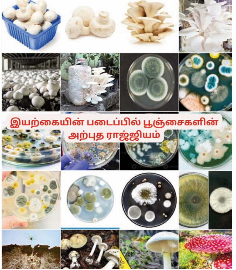
இயற்கையின் படைப்பில் பூஞ்சைகளின் அற்புத ராஜ்ஜியம்

இதன் தாவர உடலமானது வேர், தண்டு, இலை என பிரிக்கப்பட்டிருப்பதில்லை. பூஞ்சைகளின் உடலமானது ஹைபாக்கள் எனும் பூஞ்சை இழைகளால் ஆனது. ஒன்றிற்கும் மேற்பட்ட பூஞ்சை இழைகள் இணைந்து மைசீலியம் எனப்படும் இழைப்பின்னலை உருவாக்குகின்றன. பூஞ்சைகள் பல செல்களால் ஆன யூகேரியாட் செல் அமைப்பைக் கொண்டவை. ஈஸ்ட் போன்ற சில வகைப் பூஞ்சைகள் ஒரு செல்லால் ஆன யூகேரியாட் செல் அமைப்பைக் கொண்டவை. பூஞ்சையின் செல் சுவரானது கைட்டின் என்ற வேதிப் பொருளால் ஆனது. பூஞ்சைகளில் பச்சையம் கிடையாது. எனவே, இவை பிற சார்பு உயிரிகளாக உள்ளன. பிற சார்பு உயிரிகள் மூன்று வகையாகப் பிரிக்கப்பட்டுள்ளன. அவை, ஒட்டுண்ணிகள், மட்குண்ணிகள் மற்றும் இணைப்புயிரிகள் ஆகும். ஒரு சில பூஞ்சைகள் மட்குண்ணிகளாக வாழ்கின்றன. அவை இறந்த மற்றும் அழுகிய பொருள்களின் மீது வாழ்ந்து அவற்றிலிருந்து உணவைப் பெறுகின்றன.