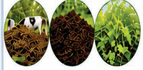
தொழு உரம் மக்கிய உரம் பசுந்தான் உரம்