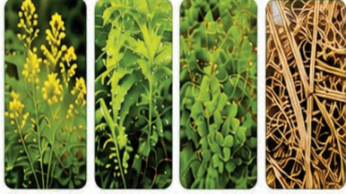
தக்கைப்பூண்டு சண்பயை செல்பானியா தானிய-பயறு வகை கழிவுகள்