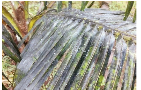
தென்னையை பாதிக்கும் ரூகோஸ் சுருள் வெள்ளை

● தென்னை ஓலைகளின் அடிப்பகுதியில் அதிக அழுத்தத்துடன் தண்ணீரைப் பீய்ச்சி அடிப்பதன் மூலம் வெள்ளை ஈக்கள், கூட்டுப் புழுக்கள் மற்றும் மெழுகுப் பூச்சுகளைக் குறைக்கலாம்.